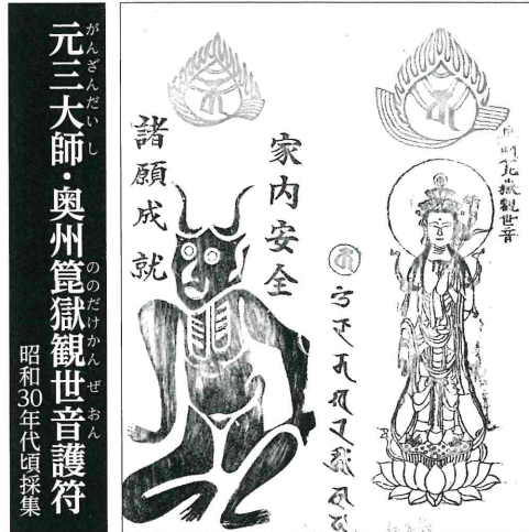
元三大師・奥州笹嶽観世音護符 昭和30年代頃採集

仙台市青葉区大倉・小倉神社発行の「八枚飾り」を家庭で飾る様子。おかざり・きりこ・きざみものなどと呼ばれる仙台地方の正月迎えの切り紙は、多彩な吉祥柄の図柄に特徴があります。