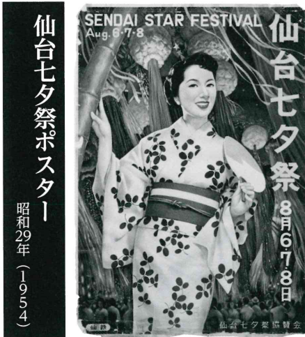
仙台七夕祭ポスター 昭和29年(1954)