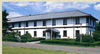
宮城県指定有形文化財