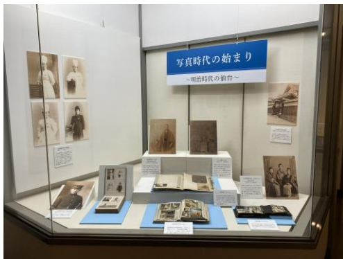
写真時代の始まり～明治時代の仙台～