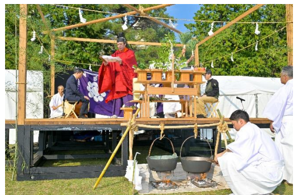
雄勝法印神楽における湯立神事

来年度も「れきみん秋祭り2024」と題して今年度と同様に通常規模での開催を予定しております。皆様のご来場をお待ちしております。