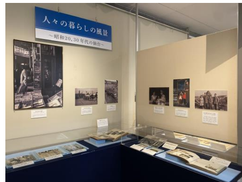
人々の暮らしの風景～昭和20、30年代の仙台～