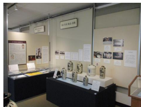
酒の生産・販売・消費