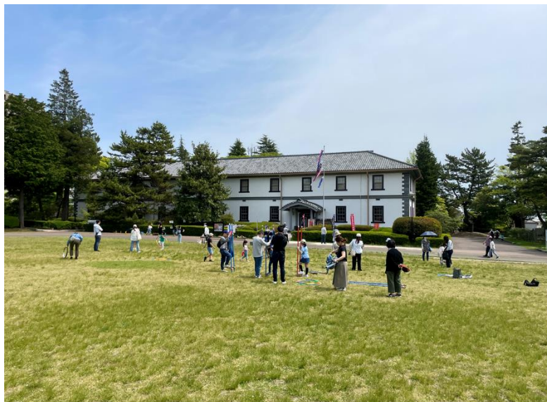
令和5（2023）年5月5日 ゴールデンウィークおもしろ昔たいけん