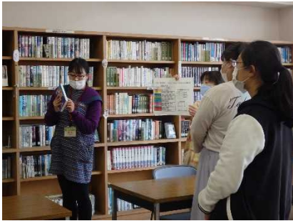
書架の整理について説明を受けました