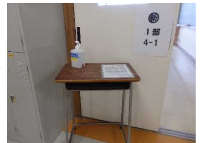
各教室にも手指消毒 用アルコールを設置