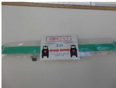
ソーシャルディスタンスを 意識する工夫