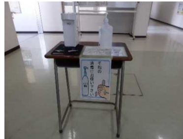
昇降口前 手指消毒用 アルコール

新型コロナウイルスの感染状況については、変異株の感染者増加もあり、まだまだ油断はできません。学校生活においても制限されることがありますが、新学期がスタートし、2ヶ月になろうとしています。生徒たちは、昇降口での手指消毒やマスクを着用しての会話など新しい生活様式を実践し、学校生活を送っています。また、1日1回、教員による教室の机・椅子の消毒を実施しています。今年度も、手指消毒、マスクの着用、こまめな換気、三密を避けるなど対策を万全にし、生徒たちにはできる限り通常に近い形で学校生活を送れるよう努めていきます。