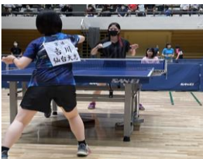
▶定通全国大会の様子①

令和5年6月17日(土)に開催された定通県大会において、卓球部女子個人第3位と好成績を収め、全国大会に出場しました。