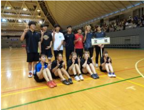
▶定通全国大会の様子①

令和5年6月17日(土)に開催された定通県大会において、バドミントン部女子団体優勝、男子個人第2位、女子個人第2位と優秀な成績を収め、2年連続で全国大会に出場しました。