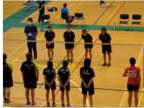
▶定通全国大会の様子②