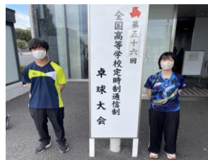
▶定通全国大会後の様子②