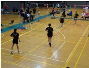
▶定通全国大会の様子③